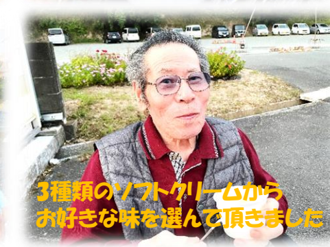
3種類のソフトクリームから お好きな味を選んで頂きました