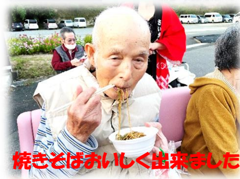
焼きそばおいしく出来ました