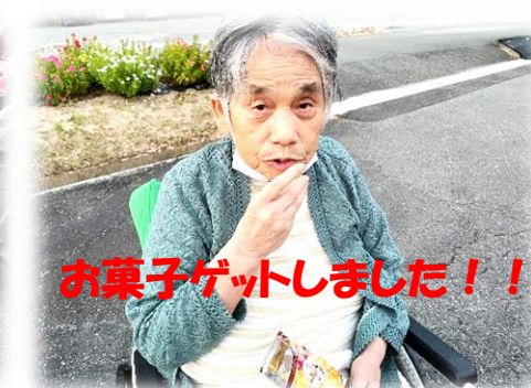
お菓子ゲットしました！！