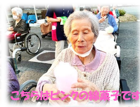
こちらはピンクの綿菓子です