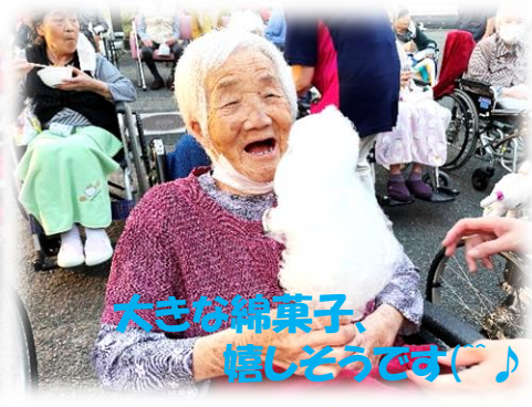
大きな綿菓子、 嬉しそうです！